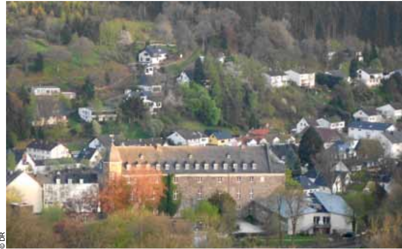
Pour les 40 ans, un déplacement en car à Schleiden aura lieu du 9 au 13 mai 2018 (Ascension) avec un hébergement en famille.