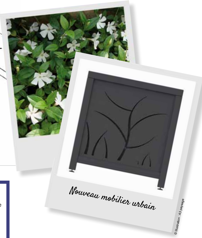
Nouveau mobilier urbain

Les travaux se déroulent du lundi au vendredi, de 8h30 à 12h00 et de 13h30 à 17h00. Retrouvez toutes les informations relatives au chantier sur le site www.lepape-tp.fr . Tous les lundis, à 16h00, le chef de chantier est disponible pour répondre aux questions des usagers.