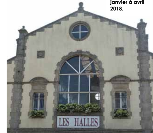
Les travaux des halles se dérouleront de janvier à avril 2018.

ment en fin d'année. La mairie a également lancé un appel à maîtrise d'œuvre pour des travaux estimés à 2,2 millions d'euros afin de diminuer le taux d'eaux parasites dans le réseau.