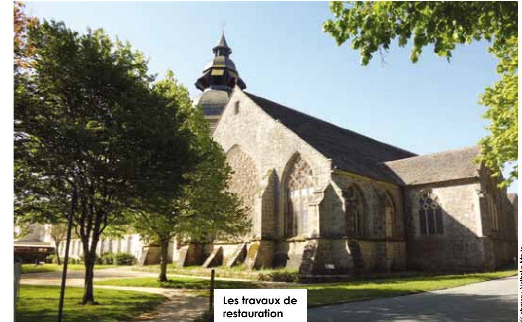
Les travaux de restauration de la sacristie de l'église Notre-Dame des Carmes ont débuté.

En octobre, novembre et décembre prochains (avec un arrêt vers le 10 décembre), les rues du Château et Général-de-Gaulle (jusqu'au Crédit agricole), la rue Jean-Jacques-Rousseau, la place des Echaudés et la rue des Carmes (jusqu'à la Rhumerie) seront réaménagées. Puis, début 2018, après les soldes de janvier, et jusqu'à avril, ce sera le