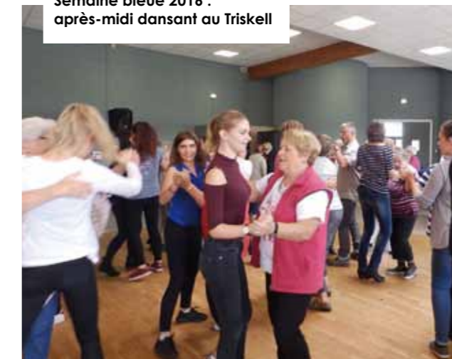
Semaine bleue 2016 : après-midi dansant au Triskell

Quant au traditionnel repas des aînés, il sera organisé au Triskell, le dimanche 15 octobre. Un courrier d'invitation sera adressé aux Pont-l'Abbistes âgés de 73 ans et plus début septembre. Pour une bonne organisation de cette journée, les inscriptions devront parvenir au CCAS avant le lundi 2 octobre.