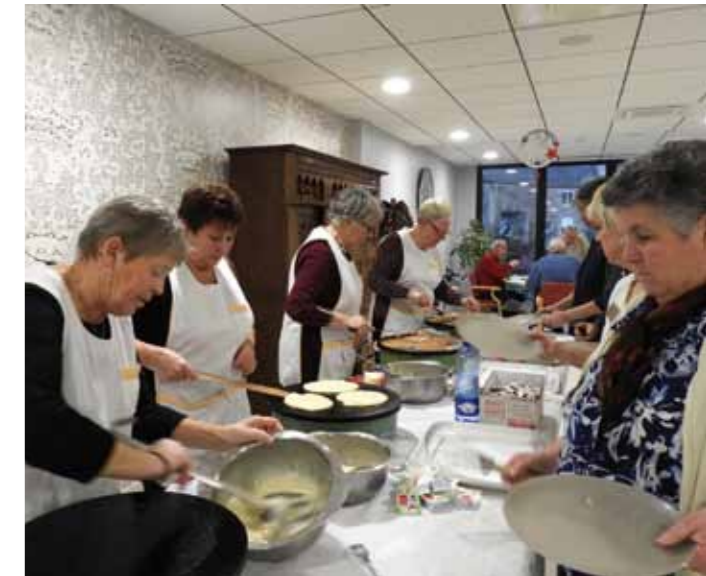
Sans oublier les bénévoles de l'association des Amis des camélias qui participent activement à l'animation de ce cadre de vie en plein changement. Goûter kouings !