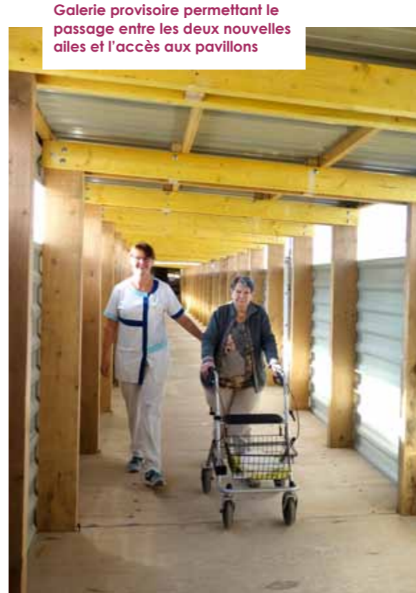
Galerie provisoire permettant le passage entre les deux nouvelles ailes et l'accès aux pavillons