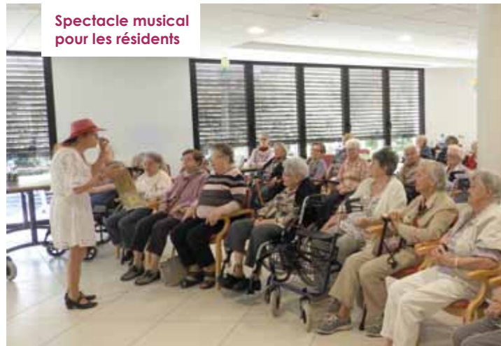
Spectacle musical pour les résidents

Une transformation en trois phases pour un lieu de vie fonctionnel, chaleureux et adapté.