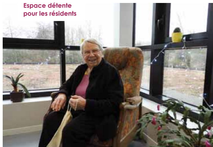
Espace détente pour les résidents

plus de ces 45 chambres, l'une des deux salles de bain thérapeutiques est fonctionnelle, la seconde sert provisoirement de salon de coiffure/esthétique. Un salon d'étage permet à l'atelier tricot de poursuivre ses activités au calme et l'atelier jardinage peut investir les deux jardins d'hiver. Des locaux fonctionnels et adaptés que les résidents et