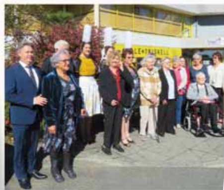
Le repas des aînés au centre culturel Le Triskell