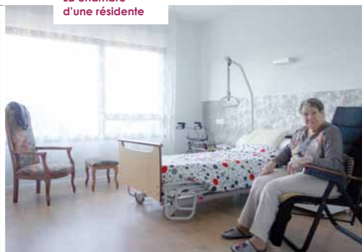
La chambre d'une résidente