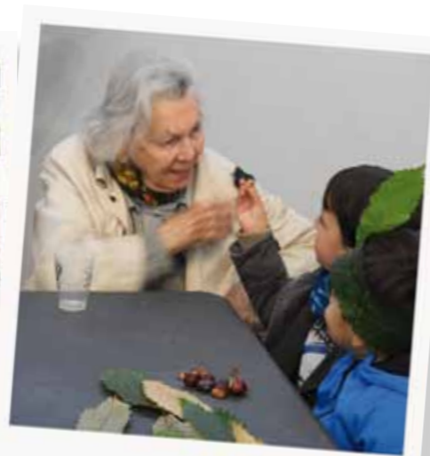
Balade rando nature suivie d'un goûter