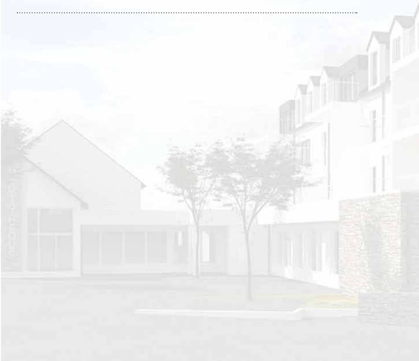
Le hall du futur cinéma de Pont-l'Abbé sera aménagé dans l'ancienne halle à marée, rue de la Gare