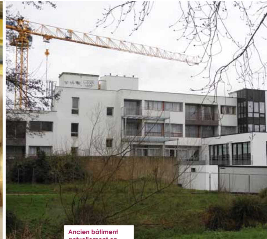
Ancien bâtiment actuellement en cours de rénovation

le personnel se sont immédiatement appropriés !