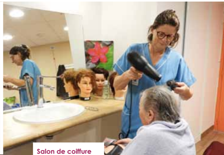
Salon de coiffure

La première phase, terminée en juin 2017, a permis la livraison de la salle à manger et l'installation du troisième ascenseur. L'ensemble des résidents a donc pu rapidement profiter de cette nouvelle et spacieuse salle de restaurant climatisée et largement ouverte sur une terrasse et sur le parc des camélias, et qui sert aussi de salle