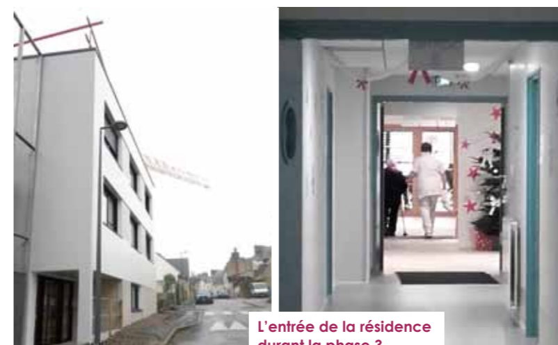
L'entrée de la résidence durant la phase 3

des salles communes à chaque étage ainsi qu'une cuisine et une lingerie aux normes. Le CCAS et les services à domicile viendront prendre place au rez-de-chaussée de ce nouveau bâtiment. Rendez-vous fin 2019 pour une présentation complète de cette rénovation !