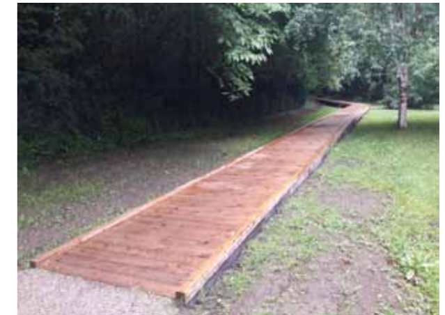
Un chemin a été aménagé dans la propriété du foyer afin de permettre aux résidents d'accéder à un centre commercial limitrophe. L'accès est autorisé au public à condition qu'il soit respecté. Ce chemin doit être facilitateur d'échanges et de rencontres.

Le projet d'établissement s'appuie sur la « parole - l'expression du résident » et des projets personnalisés pour que chaque personne puisse exercer sa citoyenneté et bénéficier d'une vie personnelle et sociale épanouissante. L'établissement est propriétaire d'un terrain qui permet aux résidents et professionnels d'accéder à un centre commercial limitrophe de sa propriété. Il relie la rue Charles le Bastard à la zone commerciale « Leclerc ». Cependant, l'accessibilité à ce chemin était laborieuse du fait de l'embourbement des fauteuils roulants car le terrain est marécageux lors des périodes hivernales.