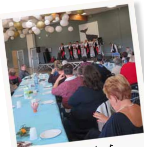
Le goûter cabaret au centre culturel Le Triskell