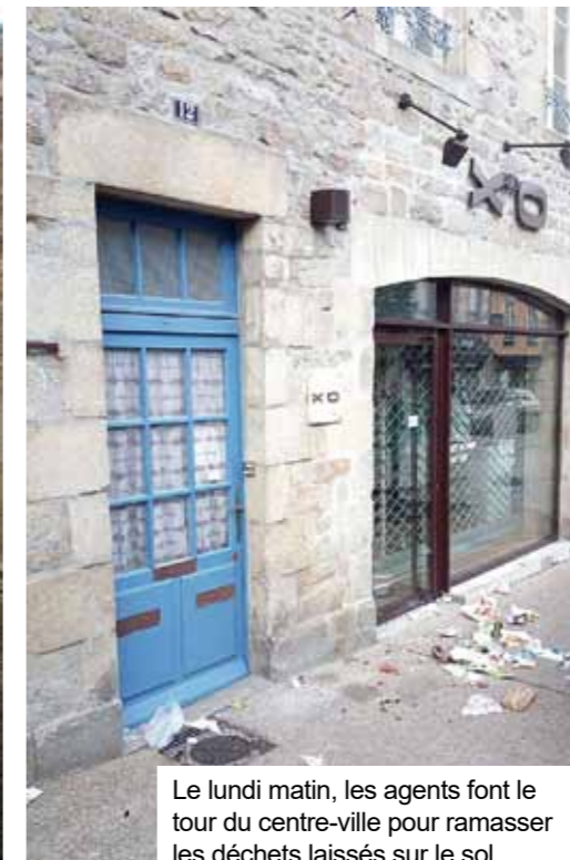
Le lundi matin, les agents font le tour du centre-ville pour ramasser les déchets laissés sur le sol

Préserver la santé des agents, réduire les déchets et l'impact sur l'environnement, tel et l'objectif de la collectivité qui intègre de plus en plus les produits alternatifs pour réaliser le ménage dans les bâtiments publics. Ces nouvelles pratiques