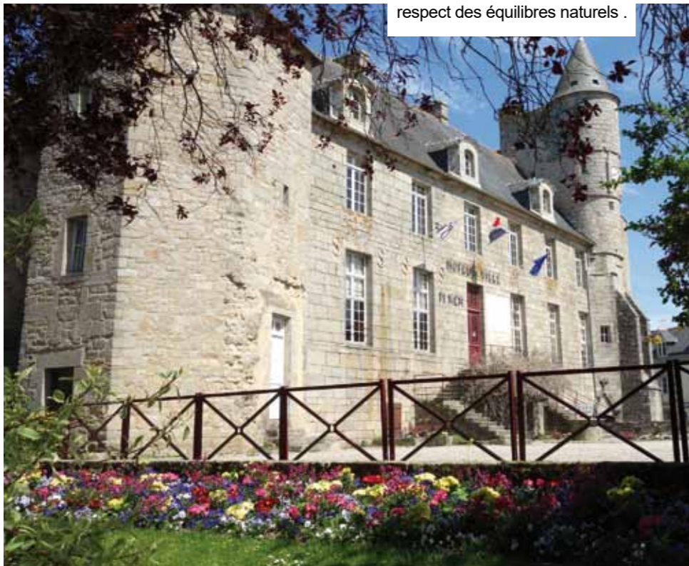
Le fleurissement se fait dans le respect des équilibres naturels.

Aujourd'hui, d'un fleurissement purement esthétique, la ville est passée progressivement à un fleurissement raisonné gardant à l'esprit la recherche du beau tout en respectant les équilibres naturels, et surtout s'intégrant au paysage local, qu'il soit urbain ou rural. Mais cette interdiction de l'usage des produits phytosanitaires s'adresse également aux particuliers. Chacun doit changer ses pratiques, comme par exemple enlever les herbes folles qui poussent sur le trottoir situé devant les propriétés. Il revient en effet aux habitants d'accomplir ces gestes, en respectant l'environnement, sans recourir aux produits chimiques.