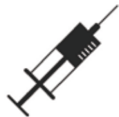
Accès à la santé