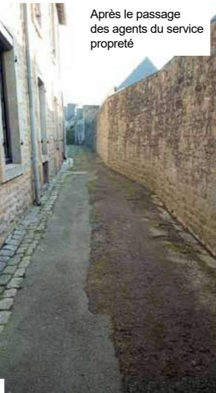
Après le passage des agents du service propreté