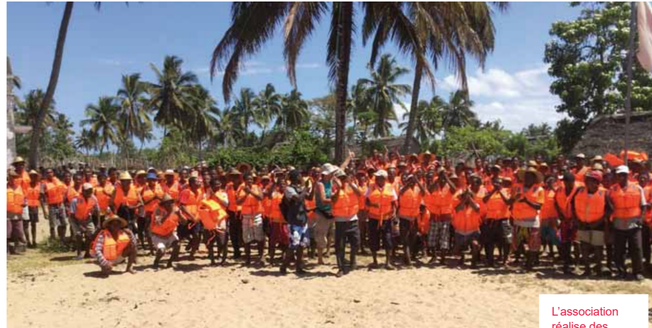
L'association réalise des actions qui visent à améliorer la vie quotidienne des populations en grande précarité comme ici avec l'achat de gilets de sauvetage pour les pêcheurs.

sibiliser à la nécessité de solidarité internationale.