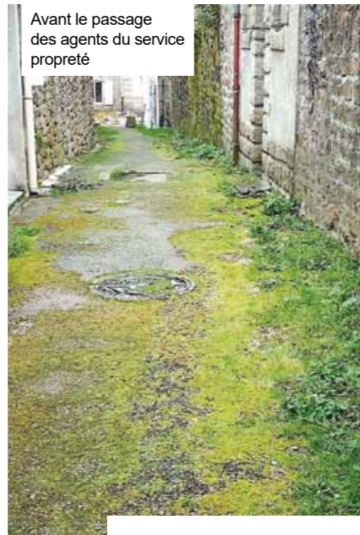
Avant le passage des agents du service propreté