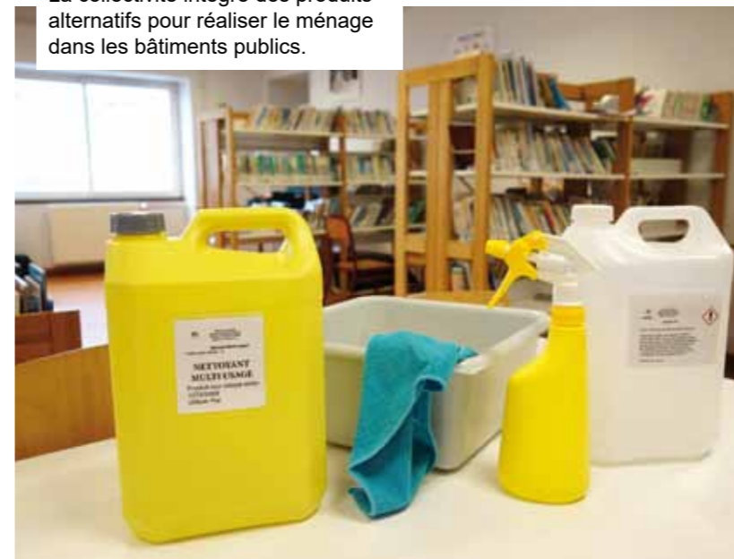
La collectivité intègre des produits alternatifs pour réaliser le ménage dans les bâtiments publics.

Les agents d'entretien sont chargés de traquer les zones sales de la ville et de régler les soucis au plus vite. Les agents du service propreté passent tous les jours. L'activité est constante. Mégots, déchets jetés sur le sol, déjections canines laissées sur le trottoir... les trop nombreux gestes d'incivilité des habitants rendent la tâche difficile aux agents chargés de la propreté. Des gestes simples, comme ramasser les déjections (en utilisant les sacs des distributeurs de la ville ou en réutilisant les sacs de fruits et légumes par exemple) ou jeter ses poubelles dans les conteneurs dédiés à cet effet et placés dans différents points de la commune contribueraient à améliorer l'image de la ville et permettraient aux agents de se concentrer sur d'autres actions. Toutes ces charges supplémentaires de nettoyage, comme le ramassage de dépôts sauvages, sont supportées financièrement par le contribuable.