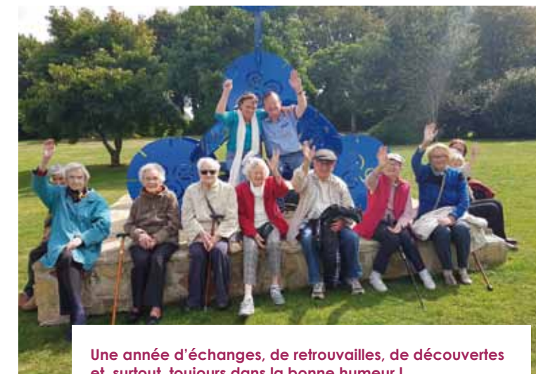
Une année d'échanges, de retrouvailles, de découvertes et, surtout, toujours dans la bonne humeur !

Le programme des animations 2020 est en cours et vous conduira certainement au cinéma et à la médiathèque. Des quizz musicaux et des jeux de mémoire seront également proposés ainsi que des spectacles. Et bien sûr toujours les promenades !