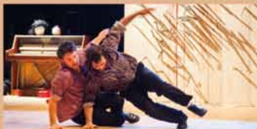
L'HERBE TENDRE Galapiat Cirque - Festival Circonova VEN. 31 JAN. & SAM. 1 FEV. - 20h Cirque