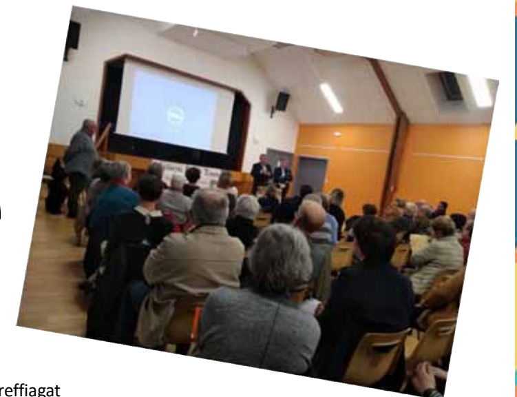
Restitution 7 novembre 2019 – Salle Craos Malo à Tréffiagat