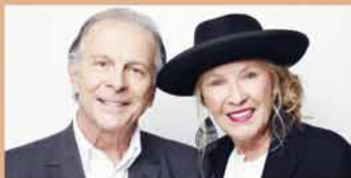
HATE LETTERS avec Roland Giraud & Maaike Jansen VENDREDI 6 MARS - 20h30 Théâtre - Humour