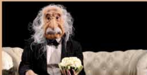
A PEU PRES EGAL A EINSTEIN Titus - Cie CausToujours JEUDI 9 AVRIL - 20h30 Théâtre - Humour