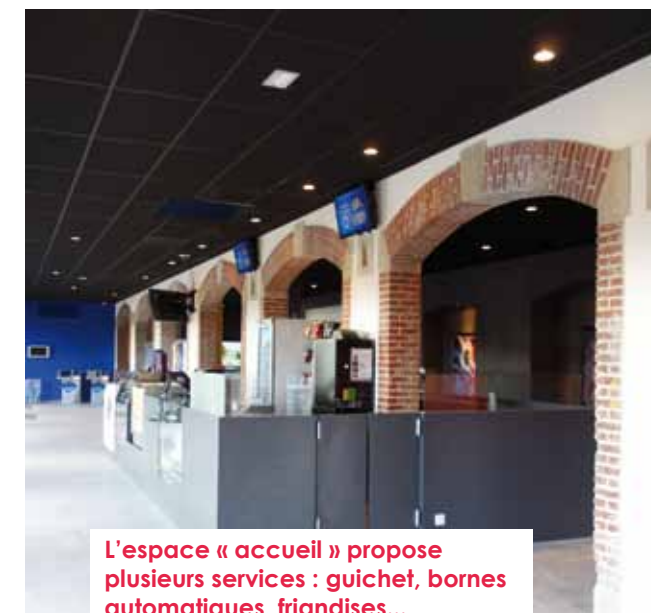
L'espace « accueil » propose plusieurs services : guichet, bornes automatiques, friandises...