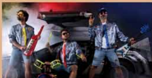
THE WACKIDS "Back to the 90's" JEUDI 20 FEVRIER - 20h Concert Rock'n'Toys I