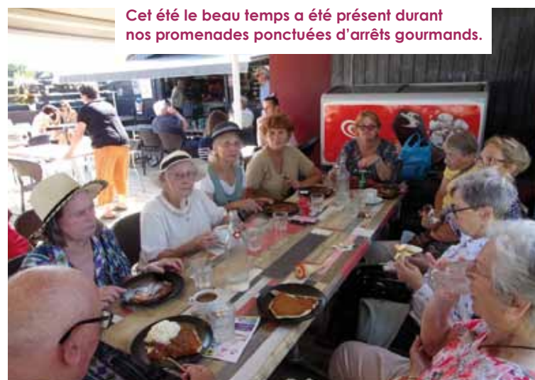
Cet été le beau temps a été présent durant nos promenades ponctuées d'arrêts gourmands.