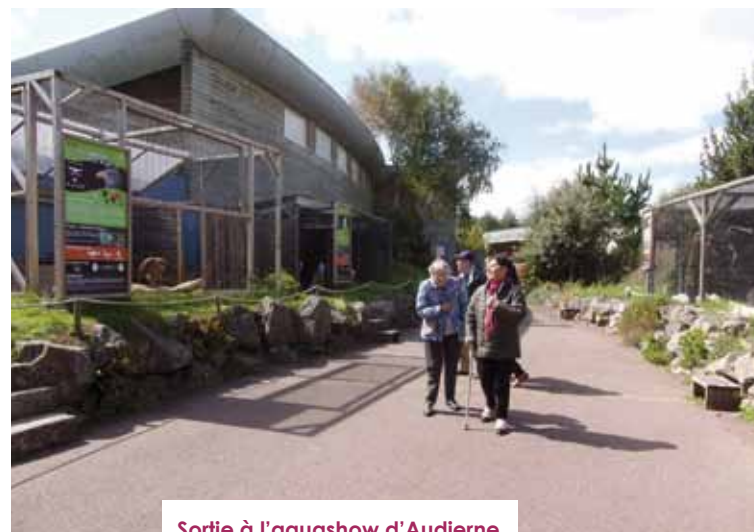
Sortie à l'aquashow d'Audierne.