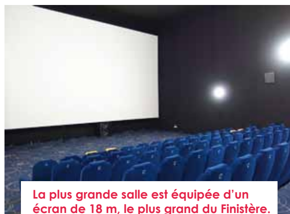
La plus grande salle est équipée d'un écran de 18 m, le plus grand du Finistère.