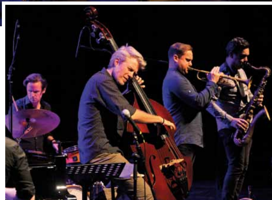
Le concert de Kyle Eastwood était programmé dans le cadre du Salon Bigouden du Livre.

(danse & jonglage), Le Paradoxe du Singe Savant (théâtre & marionnettes), Xav to Yilo (cirque & musique), Le Collectif Kaboum (cirque), Le Bagad Cap Caval, et le projet Gaviny (musique - ex Outside Duo) bénéficient de temps de résidences au Centre Culturel Le Triskell.