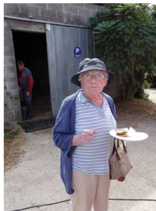
Après l'effort le réconfort !