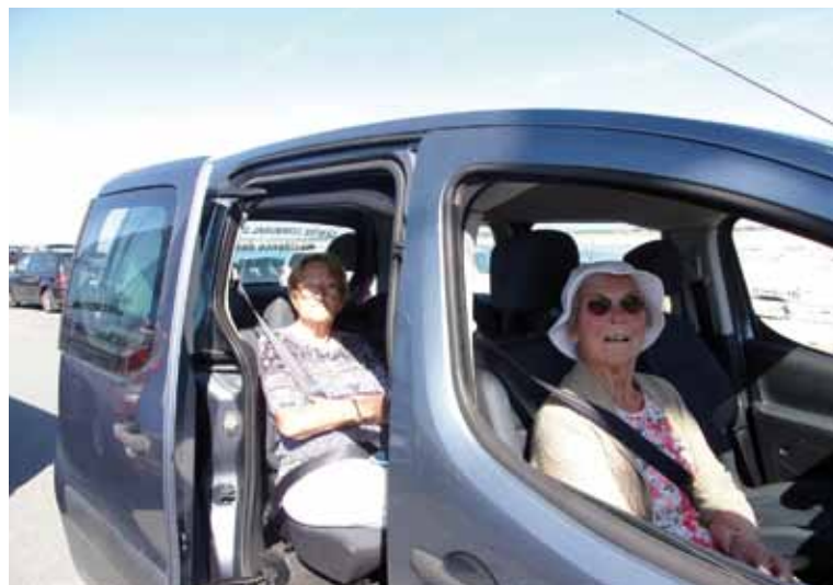
Attachez vos ceintures, on est parti !

De février à décembre 2019, 42 sorties ont été organisées avec des groupes de 9 à 20 participants : promenades, cinéma, expositions, spectacles... Nous souhaitons partager avec vous ces quelques photos souvenirs.