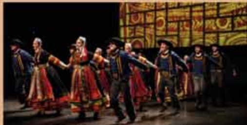
SONJ DE BRETAGNE Fête de la Bretagne SAMEDI 23 MAI - 20h30 Danses & Musiques traditionnelles revisitées