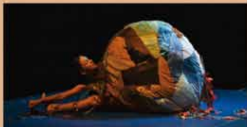
CHIFFONNADE Carré Blanc Cie - Semaines de la Petite Enfance VENDREDI 20 MARS - 17h30 Danse - Jeune public