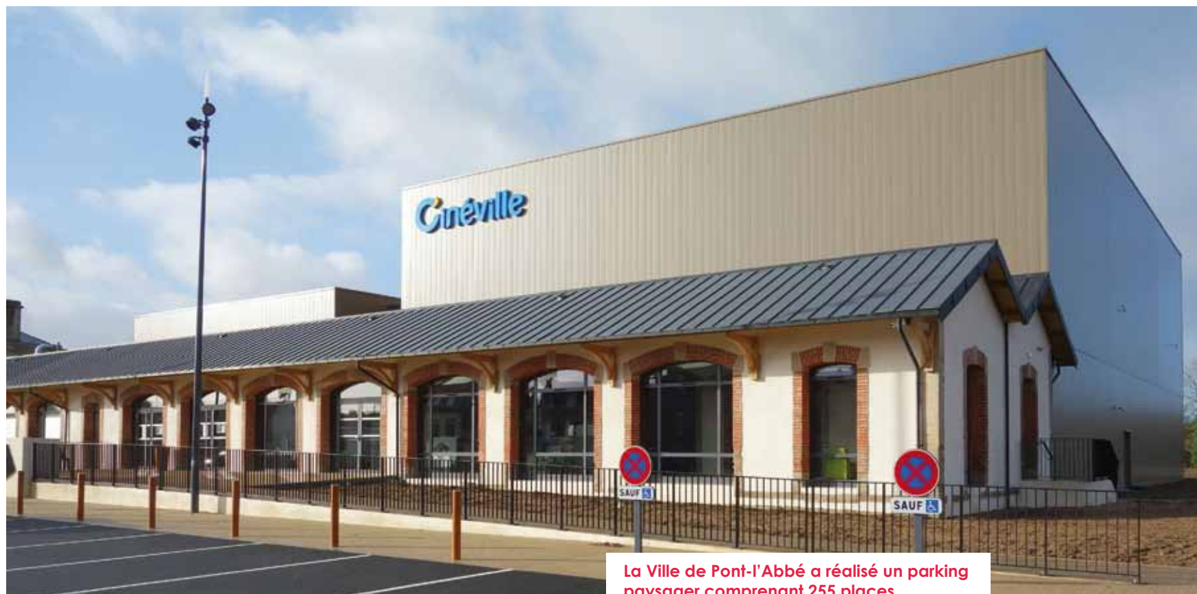
La Ville de Pont-l'Abbé a réalisé un parking paysager comprenant 255 places.