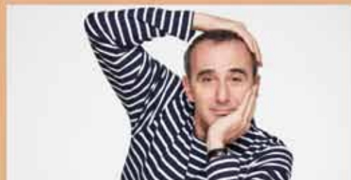
ELIE SEMOUN dans "Elie Semoun et ses monstres" SAMEDI 4 AVRIL - 20h30 One man show - Humour