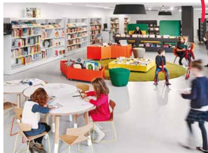
Espace enfance et jeunesse