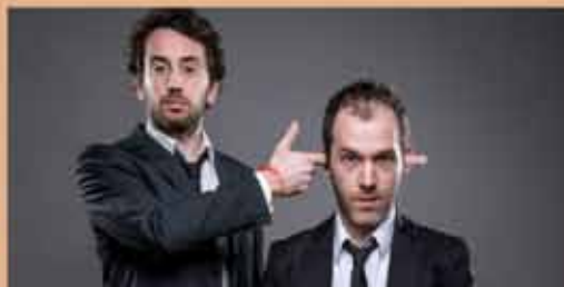
LES ILLUSIONNISTES "Puzzling" VENDREDI 27 MARS - 20h30 Magie - Mentalisme - Humour