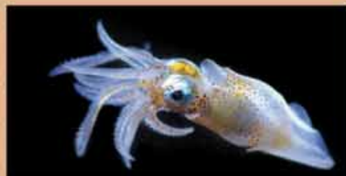
LA VOIX DES OCEANS Symphonie de la Mer DIMANCHE 9 FEVRIER - 17h Musique Classique & Cinéma