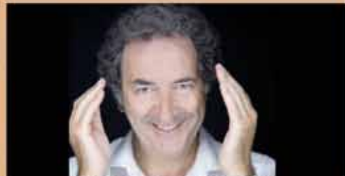
FRANÇOIS MOREL dans "Tous les marins sont des chanteurs" SAMEDI 30 MAI - 20h30 Spectacle musical