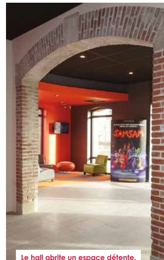
Le hall abrite un espace détente.