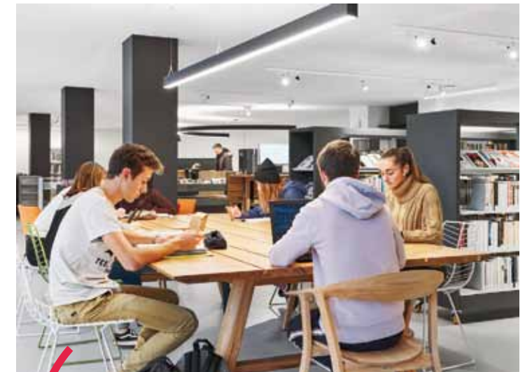
Espaces de travail