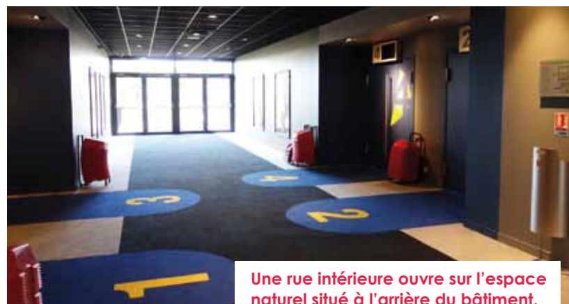
Une rue intérieure ouvre sur l'espace naturel situé à l'arrière du bâtiment.