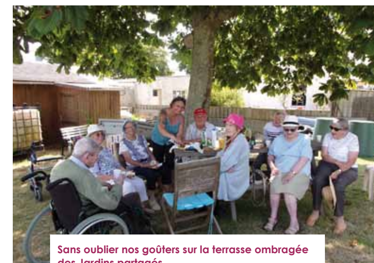
Sans oublier nos goûters sur la terrasse ombragée des Jardins partagés.