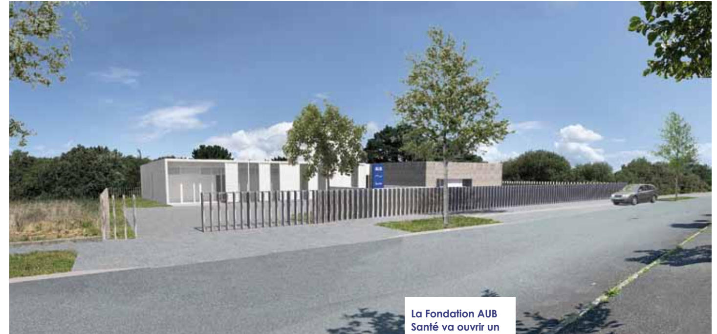
La Fondation AUB Santé va ouvrir un centre de dialyse, à proximité du siège de la Communauté de Communes du Pays Bigouden Sud et du parc aquatique.

L'AUB Santé, établissement de santé privé à but non lucratif, intervient dans les domaines des alternatives à l'hospitalisation au service des patients atteints d'une insuffisance rénale chronique et au service des patients pris en charge dans le cadre de l'hospitalisation à domicile.