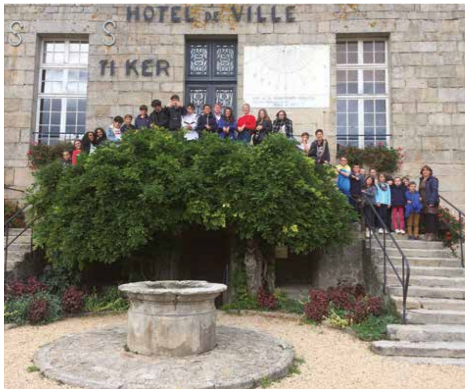
Les délégués de classes en visite à la mairie