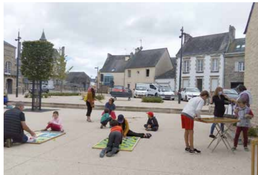
Après-midi jeux sur l'esplanade de la Médiathèque Julien Gracq

d'une thématique à chaque période de vacances scolaires. Nous fêterons donc Halloween les 28, 29 et 30 octobre prochain. « Les rendez-vous brico/déco » vous invitent en duo (parents/enfants) à scier, coller, peindre pour créer vous-même un accessoire de décoration (porte-manteau, pêle-mêle miroir naturel). La MPT anime en partenariat avec la Médiathèque Julien Gracq des rendez-vous thématique autour