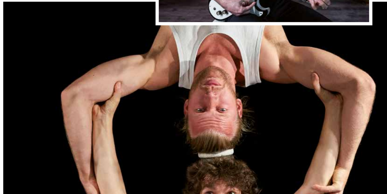
Si vous pensiez que le cirque était extraordinaire, ces deux comparses vous prouveront que vous n'avez encore rien vu. Entre grand frisson et franche rigolade, rendez-vous avec « 100 % Circus » !