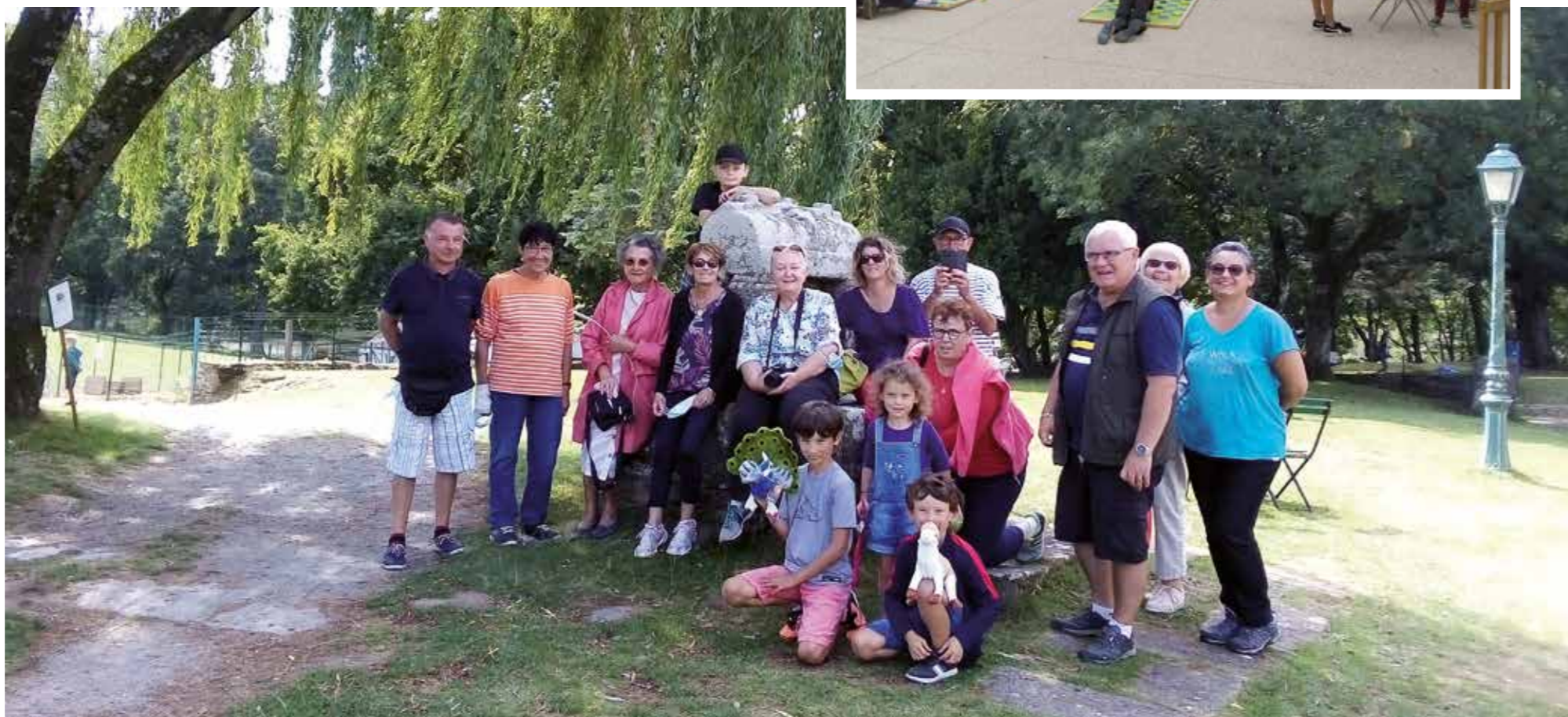
Sortie intergénérationnelle au Parc du Quinquès à Clohars Carnoët

Les activités récurrentes telles que des ateliers de couture, de cuisine, le club « dessin », le club photo, le club « Généalogie », le club « d'écriture » mais aussi l'atelier « chanson » et le « Kfé Convivial » sont toujours d'actualité.