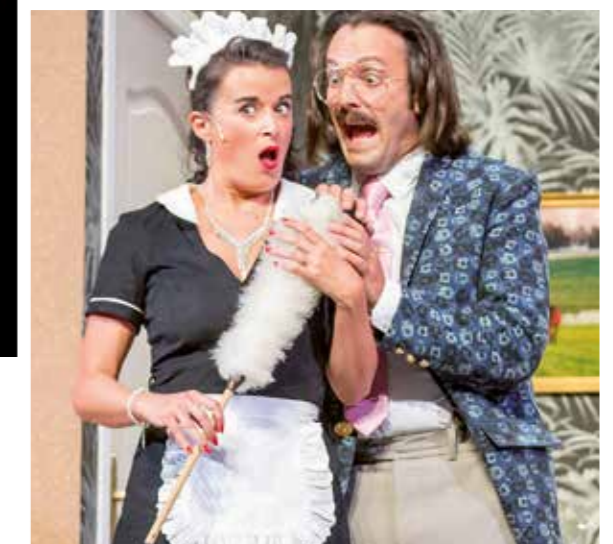
Place à la Comédie Presque Française et son spectacle hilarant : « Les Feux de l'Amour et du Hasard ».