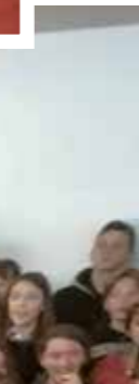
Séance de projection en visionnage individualisé