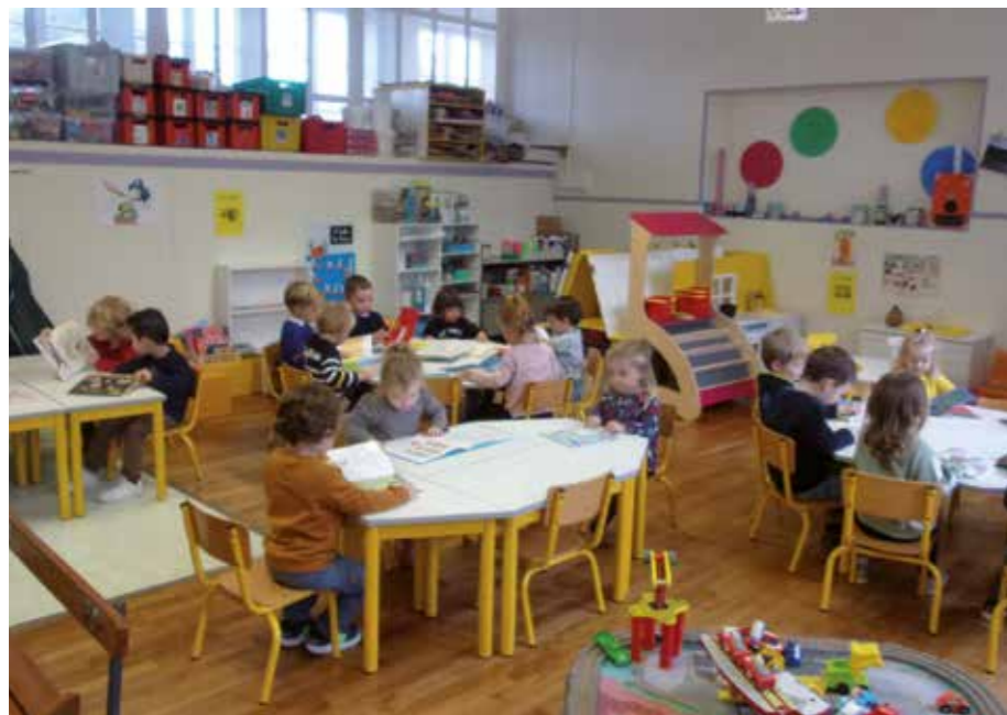
Atelier « Silence, on lit » en petite section à l'école de Kerarthur

L'école a mis en place depuis 5 ans un projet intergénérationnel avec l'EHPAD des Camélias