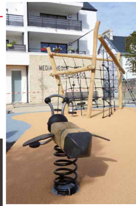
Installation d'une aire de jeux sur l'esplanade de la médiathèque. Les jeux sont fabriqués à partir de bois de robinier, très résistant et provenant de plantations sous gestion forestière responsable et durable.

Les réservations se font uniquement sur place ou par téléphone au 02.98.82.31.88