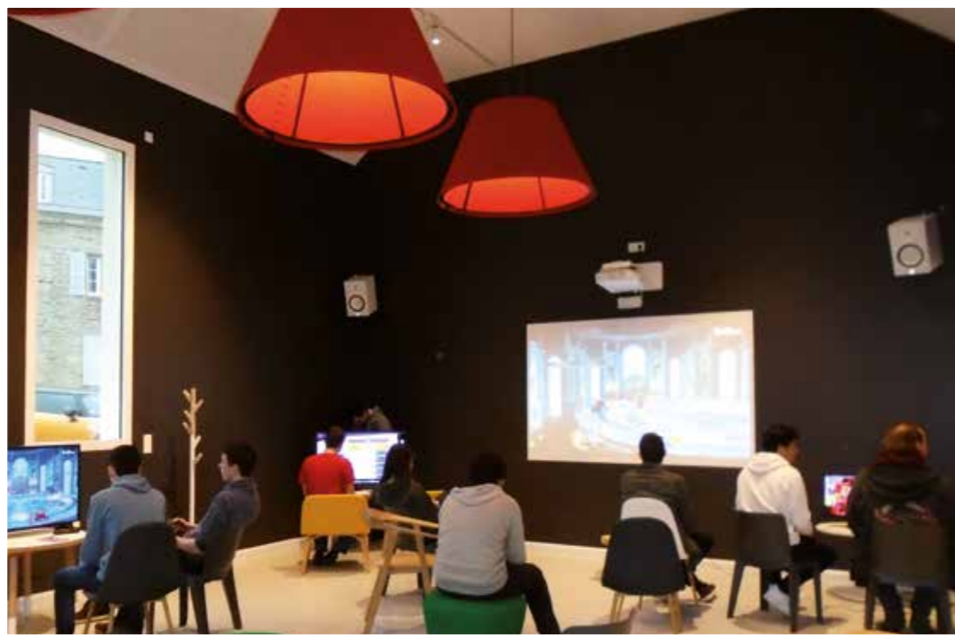
Des tournois de SmashBros ont lieu mensuellement.

Des ateliers sont également programmés : les « Ateliers bricolage » et les « Ateliers au Naturel » , qui permettent de démontrer, tout en s'amusant, que vivre en harmonie avec l'environnement, c'est possible et pas si difficile que ça. Et ceux qui auront envie d'approfondir le sujet pourront venir fouiller dans les rayons « DIY » (Do It Yourself) et les ouvrages « Environnement » de la