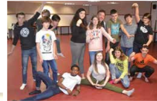
Atelier « danse » avec la Section d'Enseignement Général et Professionnel Adapté (SEGPA)