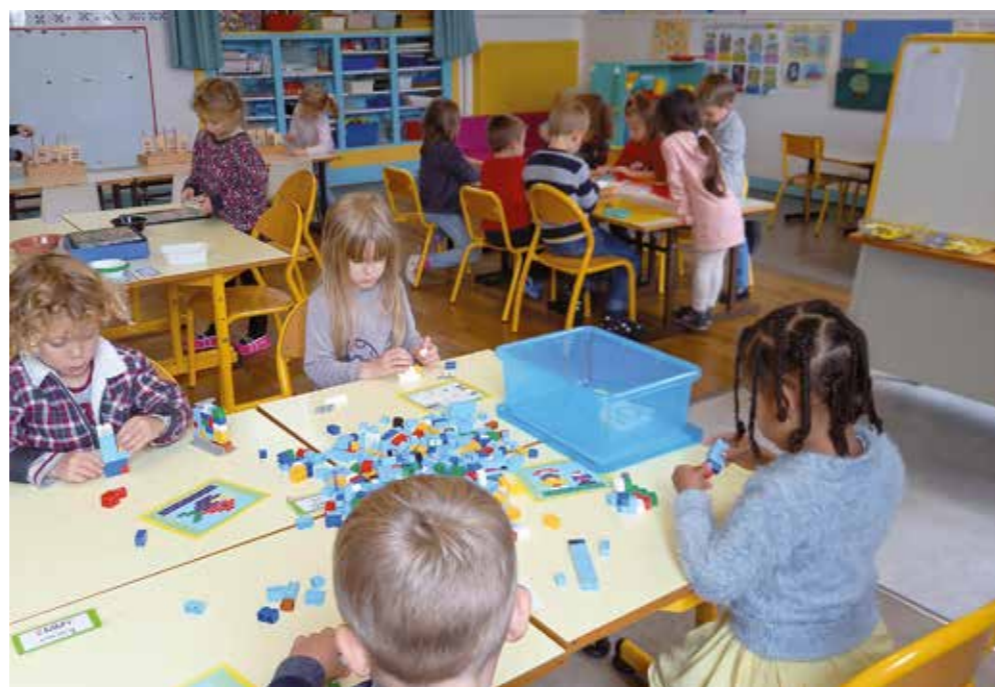
Une attention particulière est portée au bien-être des très jeunes enfants qui n'ont jamais connu la vie en collectivité.