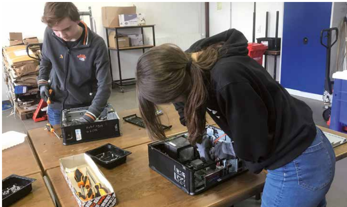
Atelier recyclage de postes informatiques