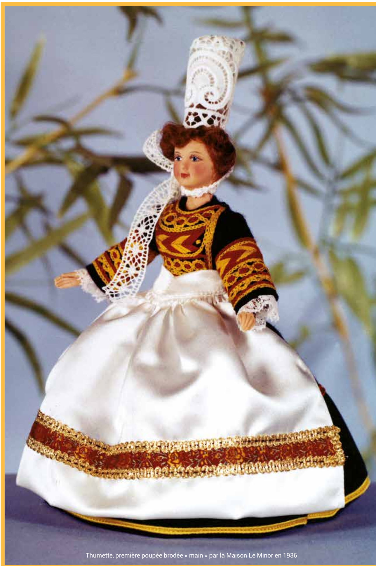
Thumette, première poupée brodée « main » par la Maison Le Minor en 1936