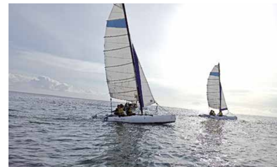
Parmi les projets importants de l'année, la classe de mer des CM2 de Jules Ferry a eu lieu du 28 septembre au 2 octobre avec, bien évidemment, quelques modifications organisationnelles du fait de la crise sanitaire