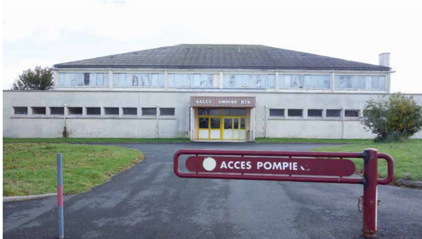
La Ville a décidé de faire appel à une assistance à maîtrise d'ouvrage, Sport Initiative, afin de l'accompagner dans un projet de réhabilitation du bâtiment.