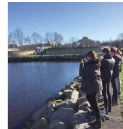
Visite de la station d'épuration de Pont-l'Abbé, qui traite les eaux usées