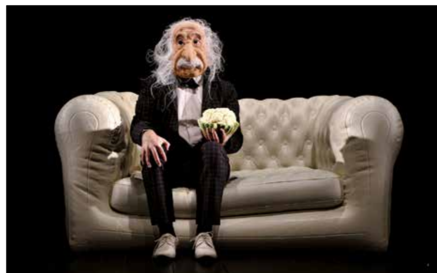
« À peu près égal à Einstein ? », une pépite d'humour et de théâtre.