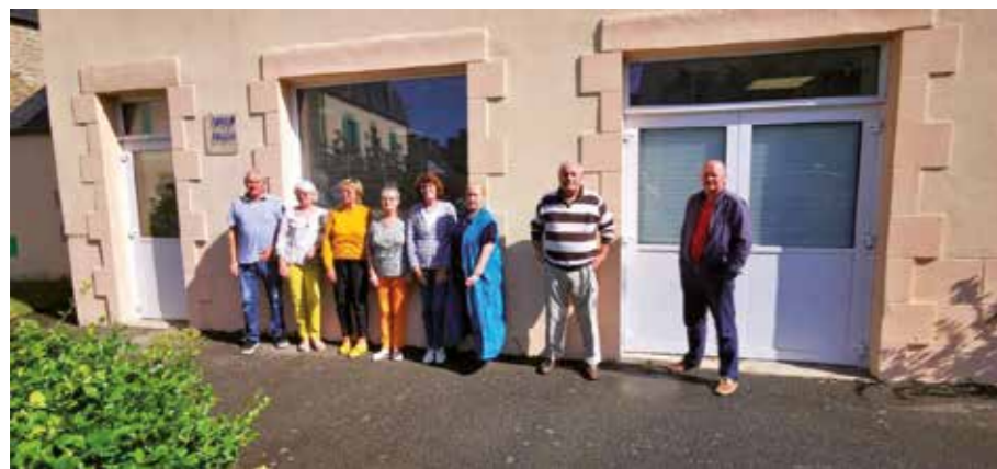
Les membres du bureau de l'AVF Pays bigouden accueillent et accompagnent les nouveaux arrivants

Visitez notre site pour découvrir nos animations, activités, sorties, soirées et autres réunions.