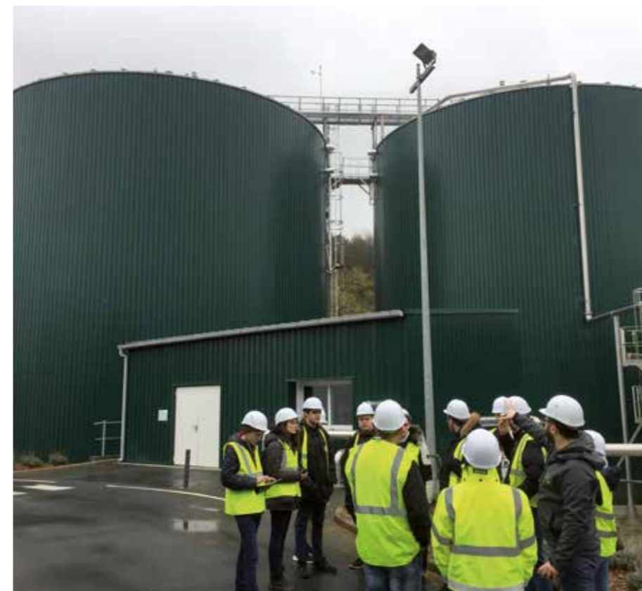
Visite de l'entreprise Liger à Locminé : usine de méthanisation et production de biocarburant (BIO GNV)