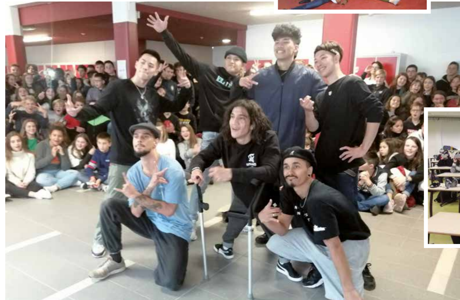
Démonstration de hip-hop par la Hip-Hop New School dans le hall du collège Laennec

En 5e, les élèves s'ouvrent à la culture à travers un parcours cinématographique qui jalonne l'ensemble de l'année scolaire. Ils sont également sensibilisés aux langues et cultures de l'antiquité, et participent à des sorties de découverte