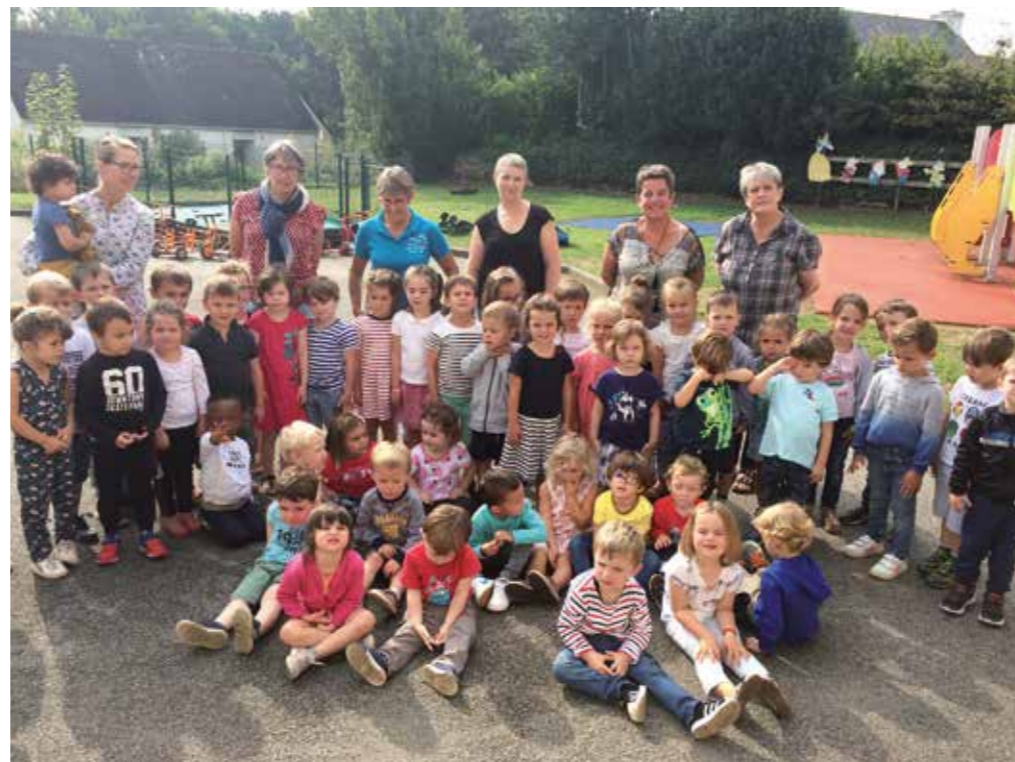
L'équipe pédagogique de Sainte-Anne, entourée des élèves