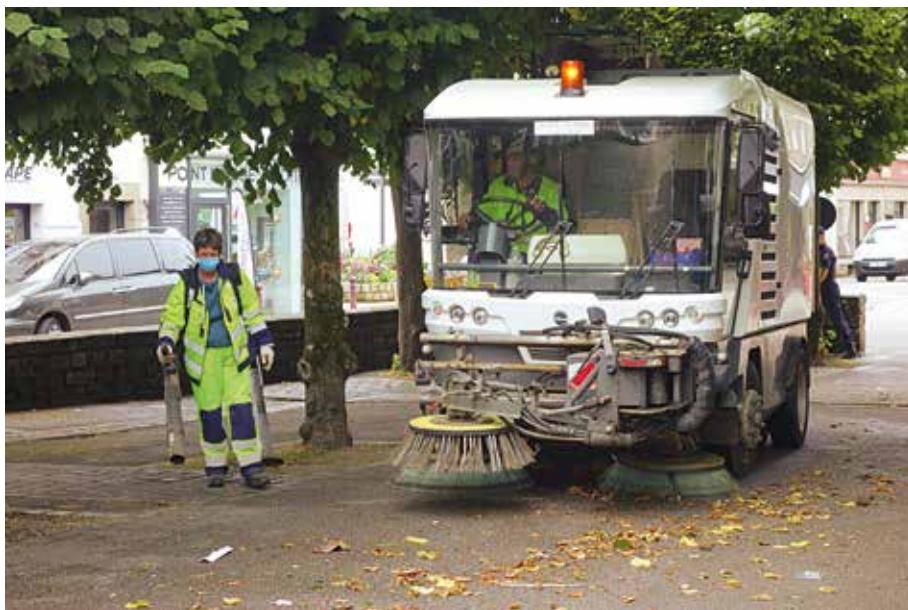
Nettoyage des places et des rues après le marché hebdomadaire.