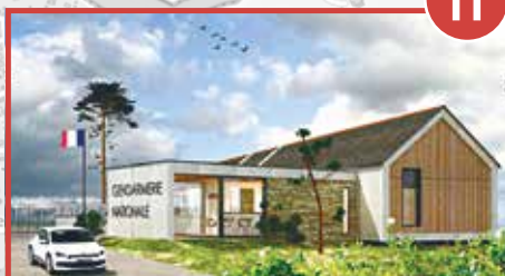
2022 Nouvelle gendarmerie