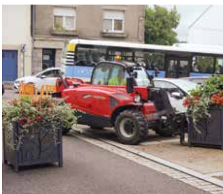
Piétonisation et sécurisation de l'espace public lors des manifestations.

Acteurs au quotidien de la gestion de l'espace public, ces hommes et ces femmes assurent à la fois l'entretien et l'embellissement de la ville, mais également les études préparatoires aux projets communaux, concernant la voirie, les bâtiments, ou les espaces verts... Acteurs de la vie publique, ils prêtent également main forte à l'organisation de toutes les manifestations (marché, braderie, concerts, fêtes...).