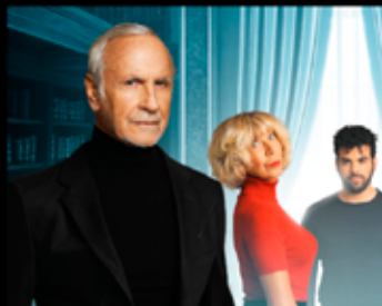
Bas Les Masques Théâtre - Polar 03 Mars - 20h30