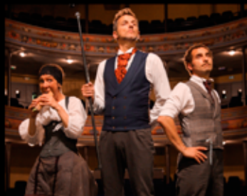
La Claque - Fred Radix Théâtre - Humour 11 Février - 20h30