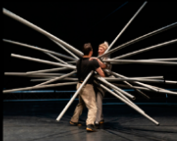
Mikado Cirque - Festival Circonova 19 Janvier - 20h00