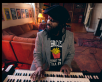
Delvon Lamarr Jazz - Organ Trio 02 Avril - 17h00