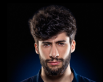
MB 14 Beatbox - Hip Hop 15 Avril - 20h30