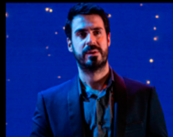
Le Discours - Simon Astier Théâtre - Humour 10 Mars - 20h30