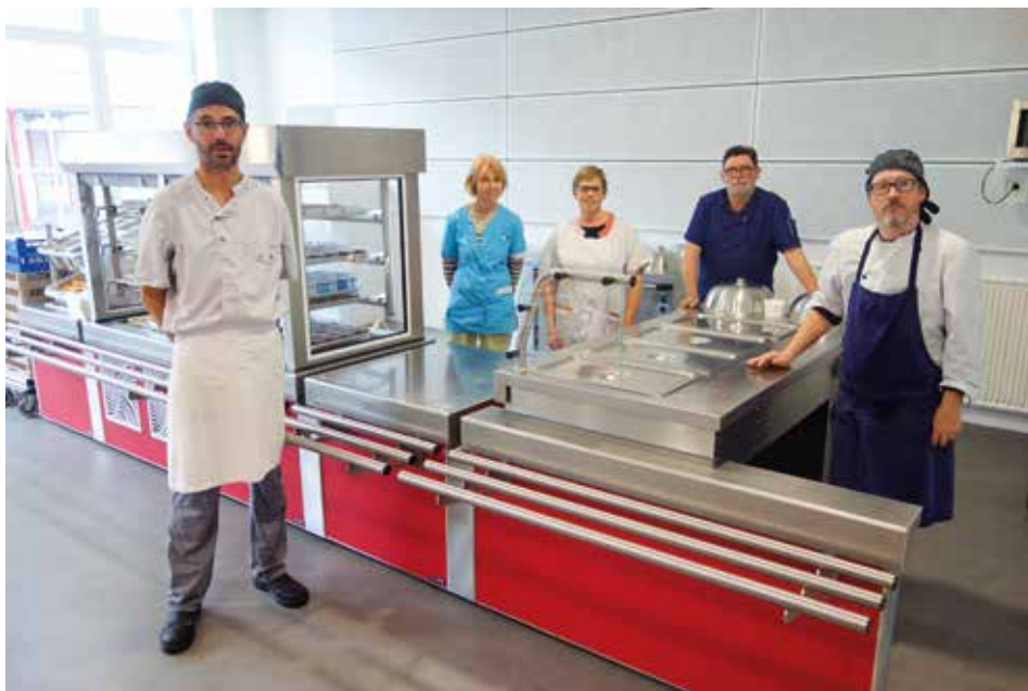
Une partie de l'équipe restauration à l'école Jules Ferry.