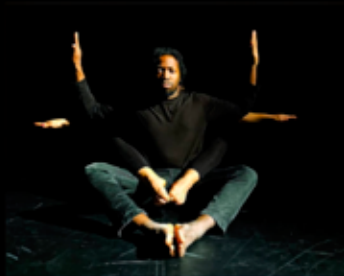
Alter - Cie Dynamina Danse 29 Janvier - 17h00