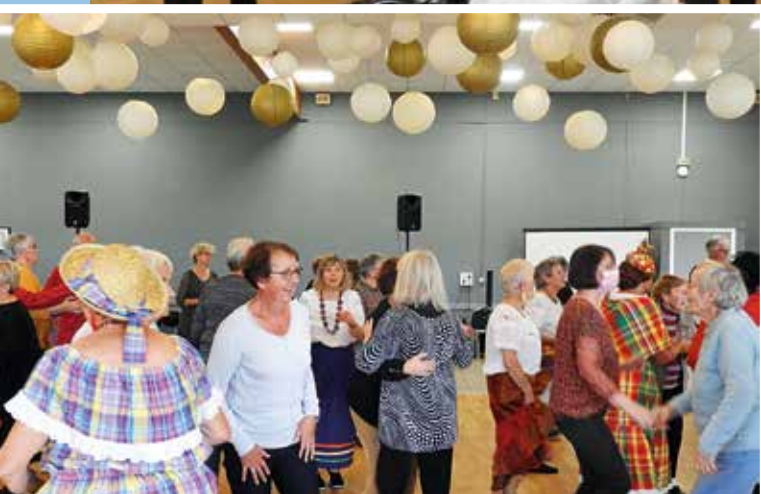
Gôûter cabaret au Triskell.