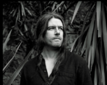
Brieg Guerveno Folk - Trad 05 Février - 17h00