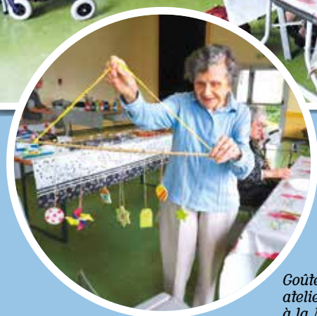
Gôûter et atelier créatif à la MPT.